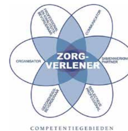
Figuur 1. CanMEDS-systematiek

Bij elke CanMEDS-rol wordt een korte, algemene beschouwing op de rol van de verpleegkundige binnen het Expertisegebied beschreven. Vervolgens worden per rol in grote lijnen de generalistische kennis en vaardigheden uit het Beroepsprofiel verpleegkundige beschreven. Vervolgens worden per rol de aanvullende, specifieke kennis en vaardigheden beschreven die een helder beeld geven van wat de verpleegkundige verstandelijk gehandicaptenzorg uniek maakt ten opzichte van verpleegkundigen in andere Expertisegebieden. De generalistische kennis en vaardigheden uit het Beroepsprofiel vormen samen met de beschrijving van de aanvullende kennis, vaardigheden en attitude van de verpleegkundige verstandelijk gehandicaptenzorg één geheel en maken samen het volledige gebied zichtbaar van de expertise die van verpleegkundige verstandelijk gehandicaptenzorg verwacht wordt.